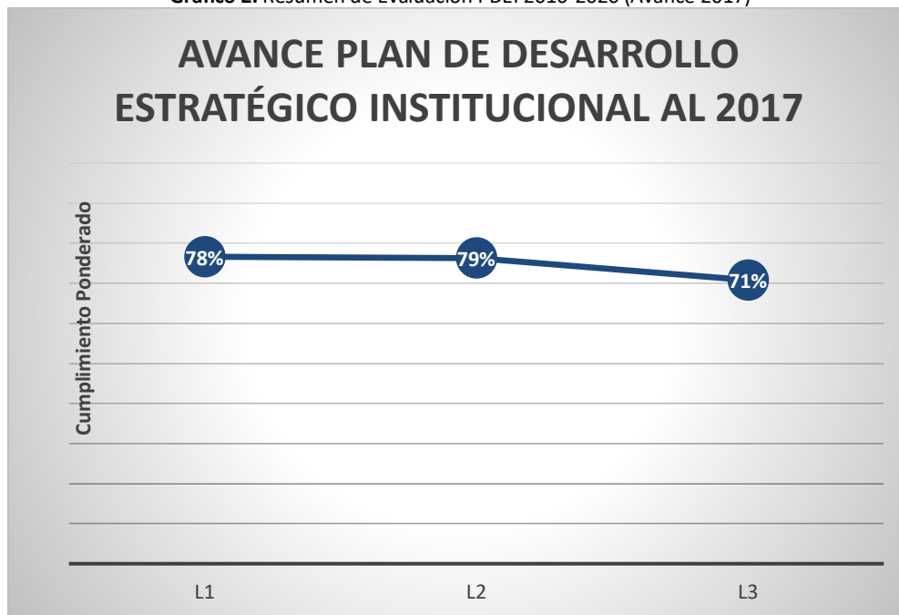
Gráfico 2. Resumen de Evaluación PDEI 2016-2020 (Avance 2017)